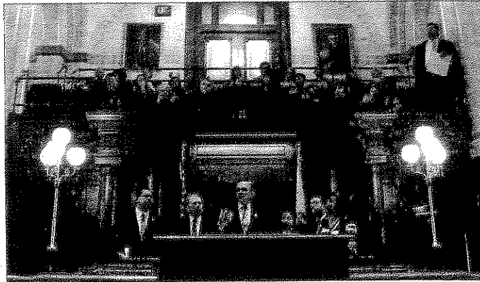
Miguel Ángel Mancera habló a favor de los migrantes mexicanos en EU.