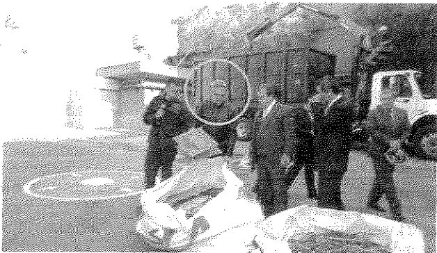
MIGUEL Mancera (círculo), Jefe de Gobierno, al supervisar la destrucción, ayer.

“La UIF ha acompañado los operativos Mala Copa en donde tenemos retiro de botellas, donde encontramos algunas que son de contrabando y otras que se presume que están adulteradas. O los cigarros también, decenas de toneladas de cigarros incautados”, agregó el jefe de gobierno capitalino.