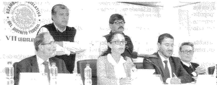
LA JEFA delegacional, ayer, con diputados y dirigentes de su partido.

En un comunicado admite que apenas a inicios de abril de 2017 solicitó la suspensión de la beca en el SNI.