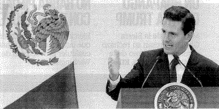
El presidente Enrique Peña Nieto

A poco más de un año de la elección de 2018, en la residencia oficial de Los Pinos analizan minuciosamente la agenda electoral de 2017 y los movimientos de los partidos rumbo a los comicios presidenciales. Nos dicen que al regreso de sus días de asueto, el presidente Enrique Peña Nieto seguirá de cerca el desarrollo del proceso electoral en curso —donde se disputan las gubernaturas de Nayarit, Coahuila y el Estado de México, “la joya de la corona”. Enseguida, se ocupará de la preparación de su quinto Informe de Gobierno y del cierre del año, cuando la sucesión presidencial estará a la mayor temperatura. Nos adelantan que conforme avancen los días será más común la entrega de obras, el cumplimiento de compromisos adquiridos en la campaña de 2012 y los comparativos, en cifras, de los logros alcanzados por la actual administración federal, frente a los gobiernos de los panistas Felipe Calderón y Vicente Fox .